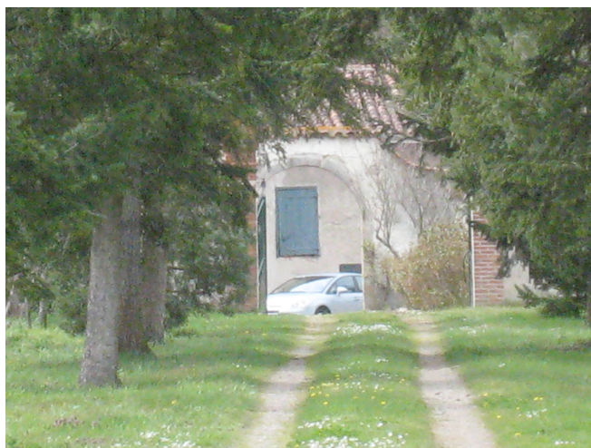
LES CHAUX OUEST Parcelles BN 111 - BN 112 - BN 113 - BN 114 - BN 115